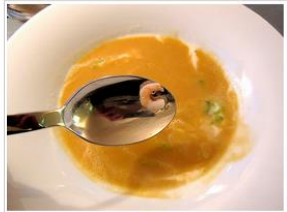
Süppchen von roten Linsen mit Crevetten und Lauch