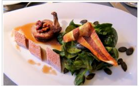
Mausohrsalat in einem Dressing von Kürbiskernöl und Sherryessig, dazu Walnussweingummi und gebratene Wachtelbrust