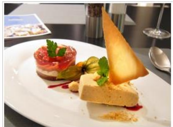
Törtchen von Feigen, Mohn und Schokolade mit Erdnuss-Crumble-Eis