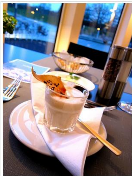
Gruß aus der Küche: Getrüffeltes Kartoffelsüppchen